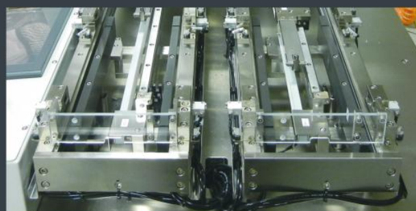
Pick two packages up at a time